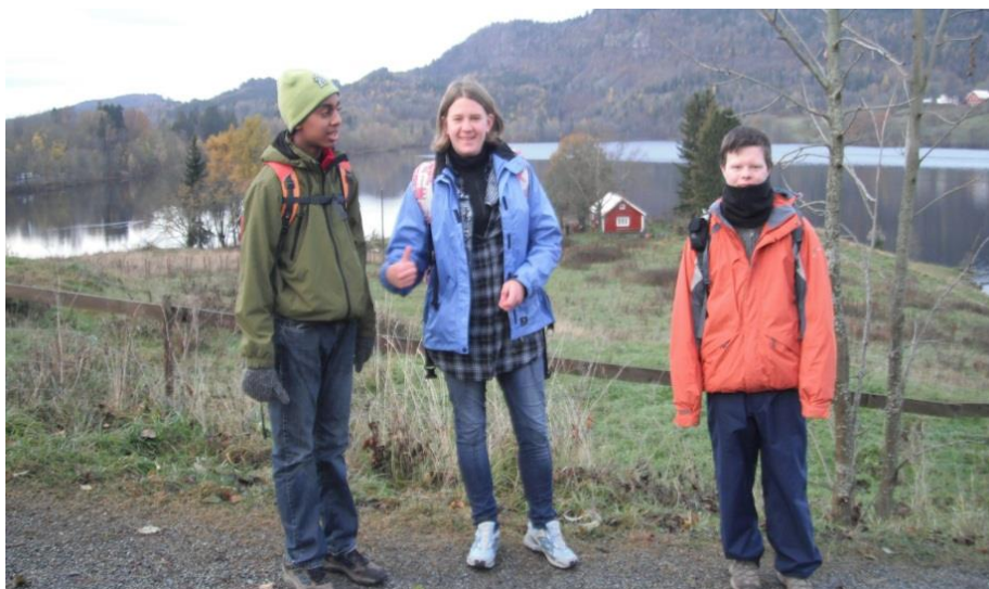
På tur ved Semsvannet

Vi er en liten avdeling og dette sammen med beliggenheten på skolen gjør avdelingen oversiktlig og skaper en god og trygg hverdag for elevene.